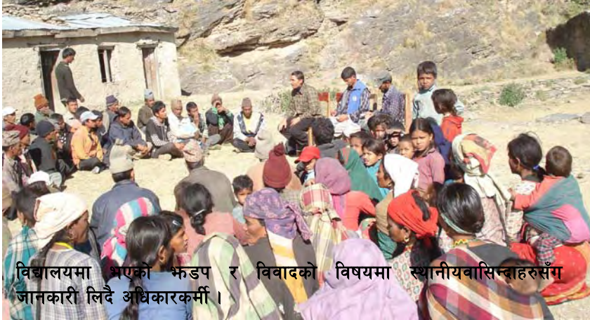
विद्यालयमा भएको झडप र विवादको विषयमा स्थानीयवासिन्दाहरूसँग जानकारी लिदै अधिकारकर्मी ।

विवादित विद्यालय पहिले नानीकोटमा थियो । वि.स. २०३० सालतिर नानिकोटबाट भिट्टामा सारिएको हो । वि.स.२०५७ साल