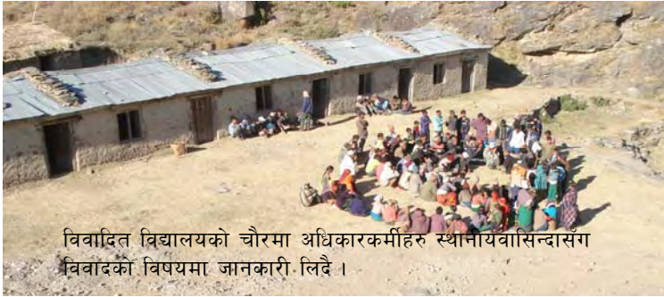
विवादित विद्यालयको चौरमा अधिकारकर्मीहरु स्थानीयवासिन्दासंग विवादको विषयमा जानकारी लिदै ।

यो विद्यालय वि.स. २०१७ साल असारबाट नानिकोटमा प्राविको रूपमा स्थापना भएकोमा त्यही निमावि सम्मको पढाइ सुरु भैसकेको थियो । सो निमावि २०२७ सालमा भिट्टामा सरेको हो । २०५० सालमा स्थायी माविको स्वीकृति पनि प्राप्त भयो