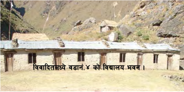
विवादितमध्ये वडानं.४ को विद्यालय भवन ।

नानिकोट गाविसको वडा नं. ५ नानिकोटमा वि.स. २०१७ सालमा सरस्वती प्राथमिक विद्यालयको नाममा स्थापना भएको विद्यालय वि.स.२०२८ सालमा सोही गाविसको वडा नं. ६ को भिट्टा भन्ने स्थानमा सरेपछि निम्न माध्यमिक विद्यालय भएको थियो । सो निर्माविले वि.स. २०४७ बाट अस्थायी माविको मान्यता पाएकोमा वि.स. २०५२/०५३ बाट स्थायी माविको मान्यता पाएको हो ।