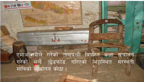
एमाओवादीले गरेको तालबन्दी विपरित कक्षा संचालन गरेको भन्दै तोडफोड गरिएको भिट्टास्थित सरस्वती माविको कार्यालय कोठा ।